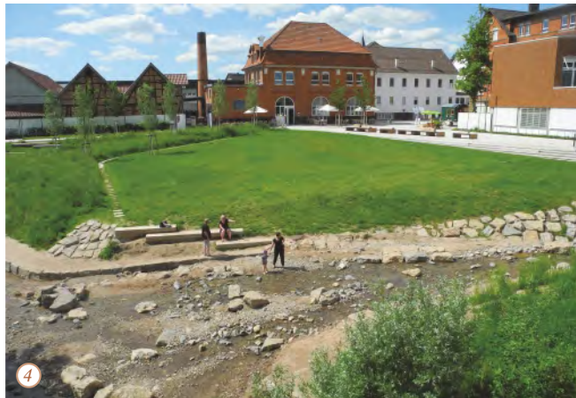
1 Kirchhof 2 Marsiliusturm, Kloster Lorch 3 Erntedankmarkt 4 Remsgarten