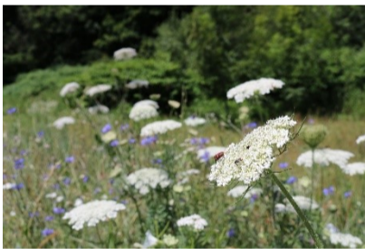
Biodiverse Flächen bieten Lebensraum für verschiedene Insekten.

Wir haben in unserer Umfrage nach den wichtigsten Themen im Projekt gefragt. Die Hauptziele im Projekt sind der Schutz und die Förderung von Insekten . Die Relevanz dieses Themas bestätigen über 73% der Befragten. Als zweitwichtigstes Thema wurden die Anlage und Pflege